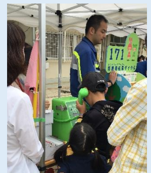
171 伝言ダイヤル・ 公衆電話使い方