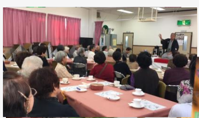
おしゃべりサロン