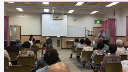
活き活き健康教室

100 円喫茶が 3 か所で開催されています。気軽に集える場所がどんどん広がっています。