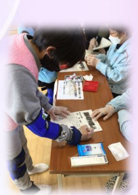
手足がまがりづらい体験