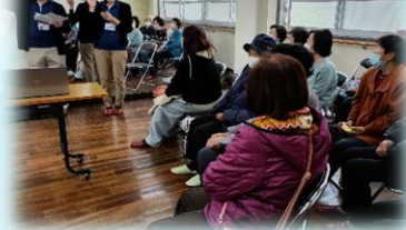
アンパス東大阪の講座