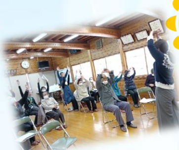
ヴェルディハノノ里の講座