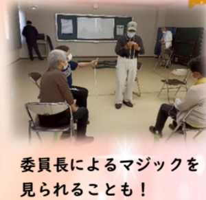
委員長によるマジックを見られることも！