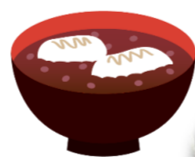
お餅がまるく出てきま