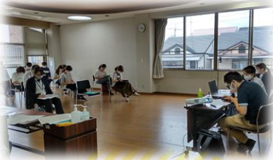
会場とオンライン(ZOOM)で開催しました。