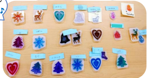
クリスマス会企画『大阪商業大学 穴戸ゼミ』の皆さん