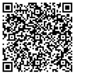
メール QR コード

発行: 東大阪市社会福祉協議会 東大阪市ファミリーサポートセンター TEL:06-6785-2625 / FAX:06-6789-5611 〒577-0054 東大阪市高井田元町 1-2-13 1F ホームページアドレス: http://www.heartnet-hoshakyo.org E-MAIL アドレス: famisapo@heartnet-hoshakyo.org