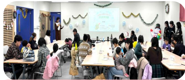
クリスマス交流会 12/14(土) 13:30~15:30