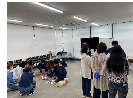
東大阪市消防局より 普通救命講習Ⅲ・AEDの使い方

第1回援助会員養成講座、長時間でしたが皆さま集中して参加してくださっていました！ 今後の援助活動、どうぞよろしくお願ひいたします。 援助会員さんでもう一度講習を受けたい方、依頼会員さんで両方会員さんにご興味ある方、次回は10月にございますので、ぜひご連絡ください(^_^)