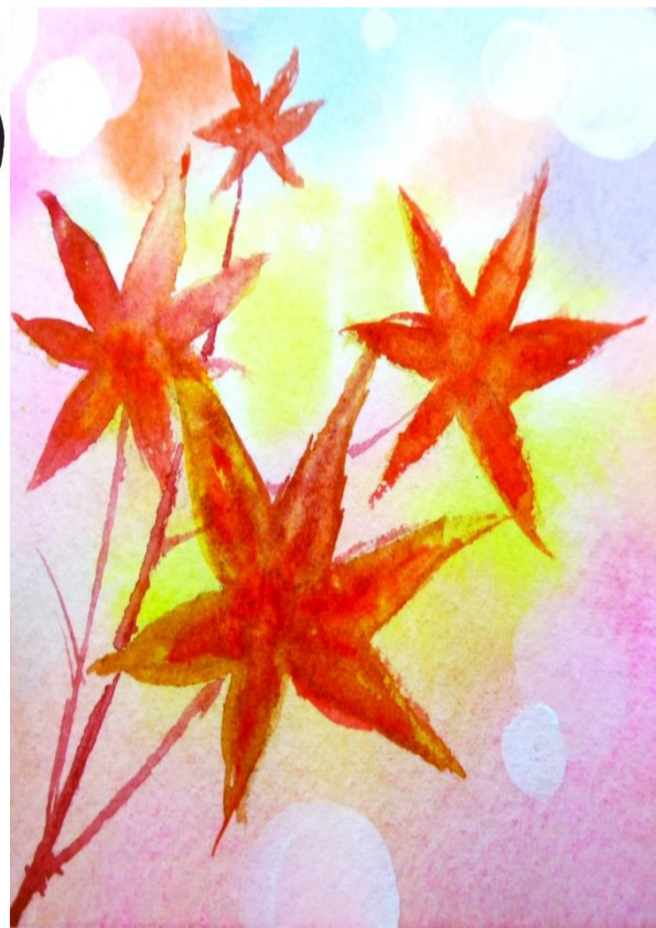
おもしろ筆ペン教室 Kayo 先生の作品です