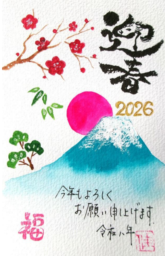
おもしろ筆ペン教室 kayo 先生の作品